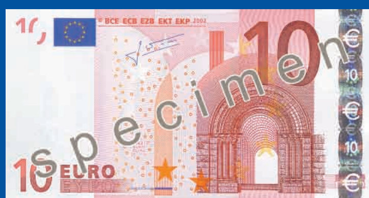
127 x 67 mm rdeč