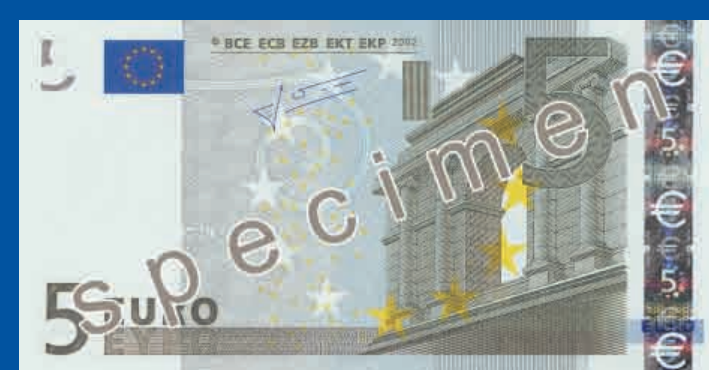
120 x 62 mm siv