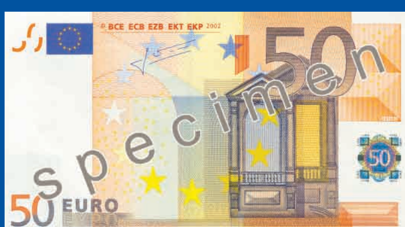
140 x 77 mm oranžen