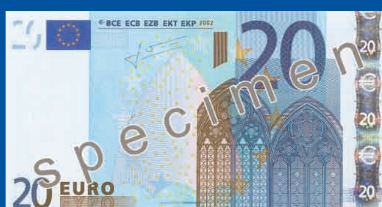
133 x 72 mm moder