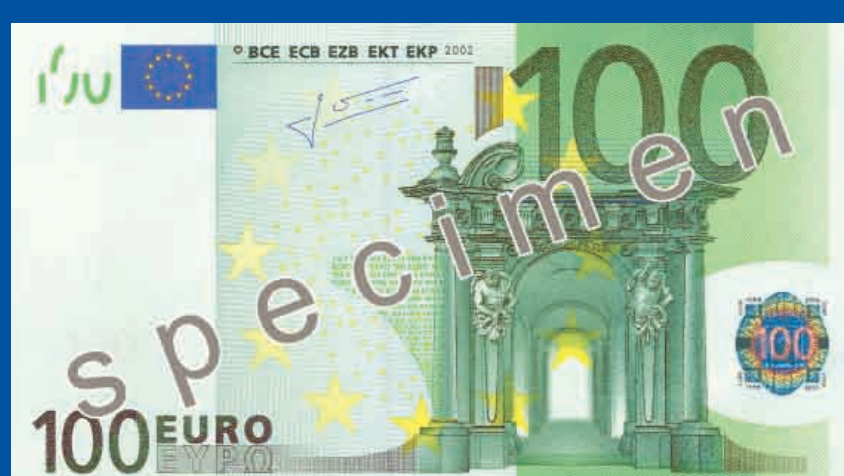
147 x 82 mm zelen