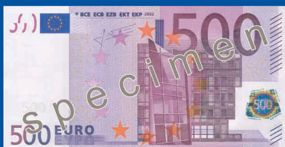
160 x 82 mm vijoličen