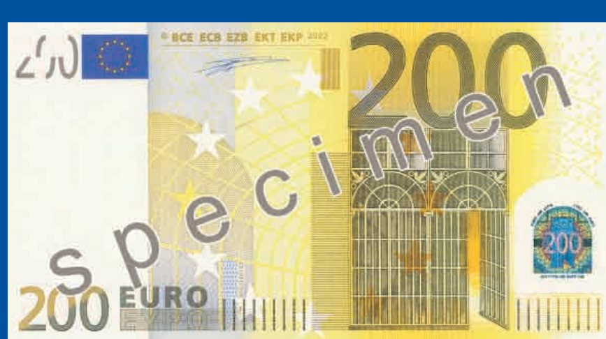
153 x 82 mm rumenorjav