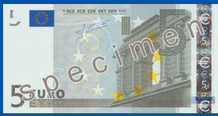
120 x 62 mm, šedá